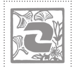
店舗紹介ページの点線の枠がスタンプスペースとなります

【注意事項】 ※定休日、営業時間は各参加店によって異なります。事前にスタンプブックで確認し、ご来店ください。